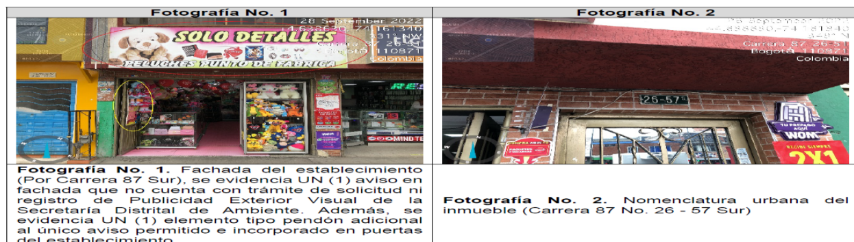
Tabla 3. Registro fotográfico

Valoración técnica y conductas generales evidenciadas (Ver Anexo No. 1. Acta de Visita No. 204764).